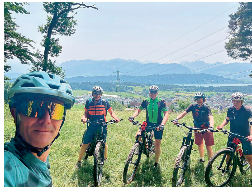
Anhöhe über Eschenbach mit Blick zum Züri Obersee

dem Linthkanal folgend und über den Seitenkanal gelangten wir nach Schmerikon und weiter dem Züri-Obersee Ufer bis zur Wirtschaft Hof in Oberbollingen. Von dort ging es durch den Chlosterwald und den Oberwald nach Wagen. Über den Curtiberg und der Tägernau erreichten wir Ermenswil, wo wir die Hauptstrasse überquerten und die schmale Strasse nach Chrauren wählten. Danach folgten Singletrails oberhalb des Katzentobels bis an den Dorfrand von Laupen, wo Mittagsrast gehalten wurde.