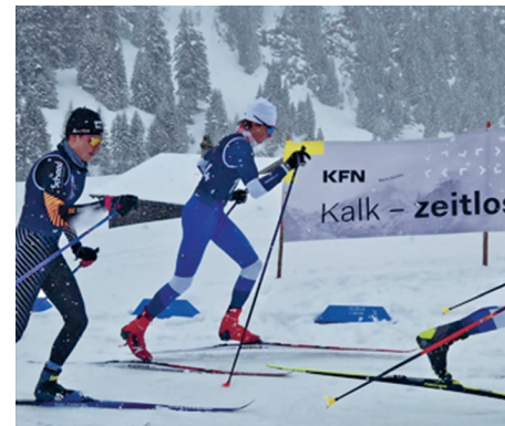
Impressionen vom Renngeschehen auf dem Urnerboden

Auch in dieser Saison wird der Wiggis-Langlauf den Abschluss des Voralpencups bilden. Zusammen mit dem Glärnischlauf des SC Riedern wird am Wochenende vom 21./22. März 2025 der Wiggis-Langlauf am Sonntag, 22. März 2025 der Schlusspunkt der Cup-Serie darstellen. Höchstwahrscheinlich auch dann wieder auf Urnerboden.